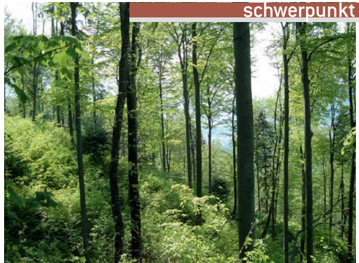
Abbildung 1: Waldentwicklungsplan 2008 und Projektgebiet