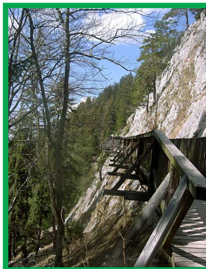
Kapaunwände am Gaisberg

Die forstfachliche Kontrolle der projektkonformen Umsetzung obliegt grundsätzlich der Forstbehörde der Stadt Salzburg (Bezirksverwaltungsbehörde). Diese erfolgt nach Vorlage des Jahresberichtes in den Monaten