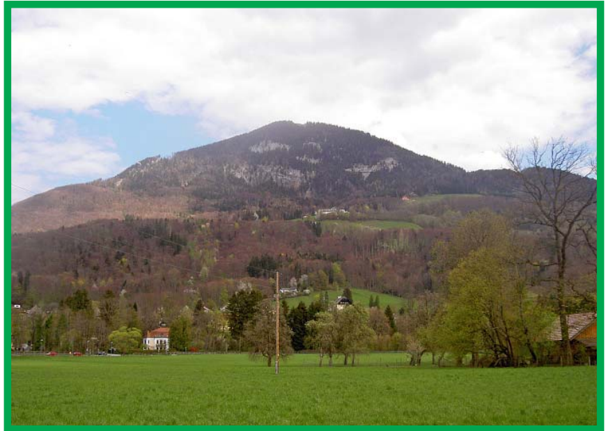
Der Gaisberg von weitem.

Geblichen waren die Probleme. Die Bannlegung 1870 konnte zwar weitere Waldflächenverluste verhindern, wirkte sich jedoch nachteilig auf die waldbauliche Qualität und somit – zeitverzögert – auch auf die Stabilität dieser Schutzwaldbestände aus. Dieser „aussetzende Betrieb“ hatte seine Ursachen in der Besitzerstruktur mit zahlreichen Kleinstwaldparzellen, in den schwierige Geländeverhältnisse (Seilbringungsgebiete) mit beschränkter Forststraßen- und Rückwegerschließung, in der Besitzerstruktur mit zahlreichen Kleinstwaldparzellen, den Vorbehalten gegenüber der forstbehördliche Bewilligungspflicht („jede Entnahme musste ausgezeigt werden“) und in zunehmend fehlenden forstlicher Arbeitskapazitäten durch die hier frühzeitig erfolgte betriebstechnische Umstellung vom Vollerwerbsbauern auf Nebenerwerb (Verdienstmöglichkeiten im Salzburger Zentralraum). Das waldbauliche Handeln beschränkte sich aus Zeit- und Kostengründen fast ausschließlich auf die Endnutzung; Vornutzungen unterblieben. Der Wandel in den Besitzverhältnissen infolge von Erbgingen und Verkäufen verschärfte diese Entwicklung; der inhaltliche Bezug (Waldgesinnung) zum eigenen